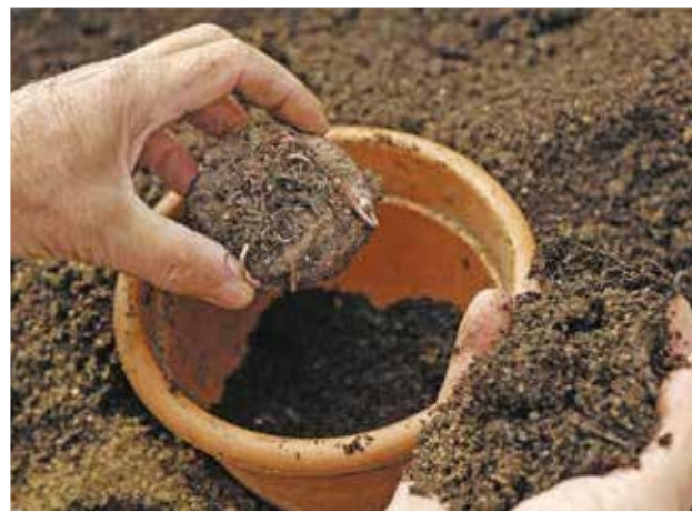
Le compost doit être mélangé avec de la terre quand il est utilisé en support de culture.

Pour la création de nouvelles jardinières, un bon mélange est constitué d' un tiers de compost, un tiers de terre et un tiers de sable . Si vous réutilisez des jardinières de l'année précédente, vous rajouterez 20 % maximum de compost à la quantité de l'ancienne terre. Vous pouvez aussi l'utiliser pour vos plantes d'intérieur de la même façon.