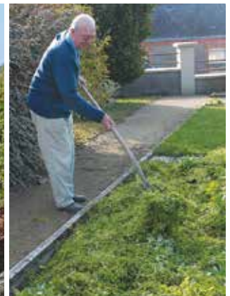
Il est possible de pailler avec des feuilles mortes ou des herbes fraîches.