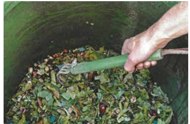
Le brassage des déchets est une des conditions de la réussite d'un compost.

réaliser un brassage régulier (notamment au début du compostage lorsque l'activité des micro-organismes est la plus forte, puis tous les 1 à 2 mois). Le brassage permet de décompacter le compost, de l'aérer et d'assurer une transformation régulière .