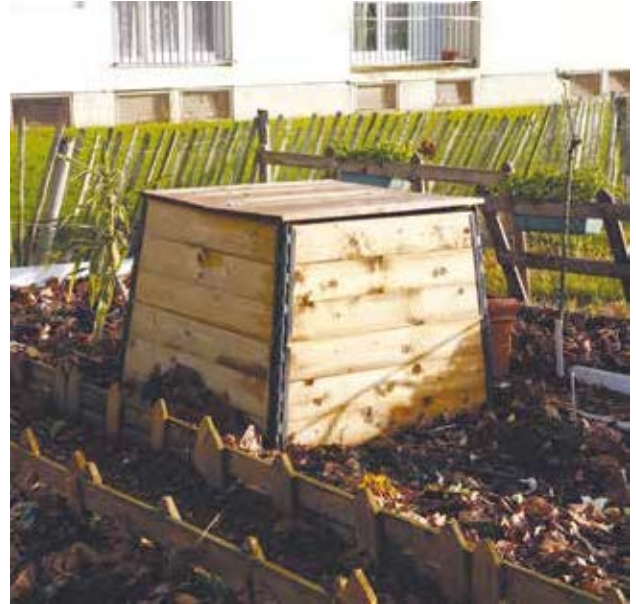
La pratique du compostage partagé se développe de plus en plus.

Dans votre immeuble, votre résidence ou votre quartier; parlez-en autour de vous pour savoir si des habitants voudraient participer; mobilisez vos voisins, c'est un des gages de réussite d'une telle opération.