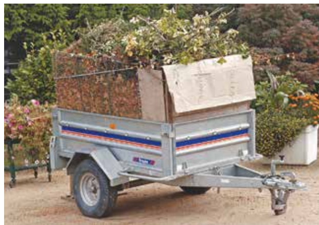
Réduire la production de déchets verts et les utiliser pour pailler votre jardin ou fabriquer du compost vous évite des déplacements en déchèterie.

en jouant sur des techniques de jardinage : moins d'engrais et d'arrosages pour limiter la croissance des plantes ; tontes, feuilles et brindilles laissées sur place ; diminution du nombre de tontes (mise en place de prairies fleuries, tontes sur certaines zones du jardin seulement...).