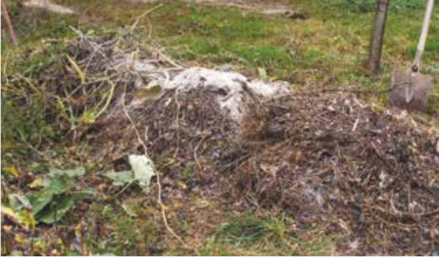
Le compostage en tas est pratique si vous disposez de place mais de peu de temps à y consacrer.