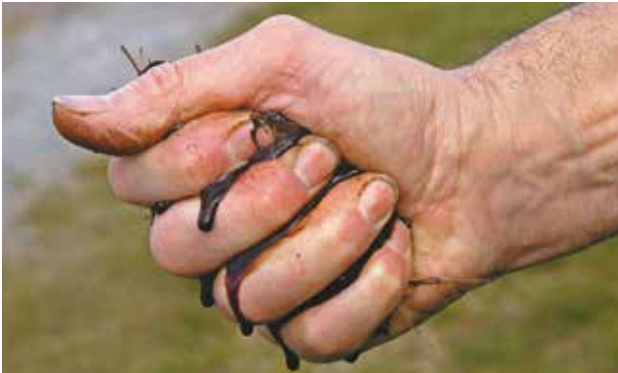
Le compost doit être humide (comme une éponge pressée) mais sans excès. Si du liquide sort d'une poignée de compost pressée, il est trop humide.

Trop d'humidité empêche l'aération : le compostage est freiné et des odeurs désagréables se dégagent. Si c'est le cas, on peut étaler le compost quelques heures au soleil ou le mélanger avec du compost sec ou de la terre sèche. Pas assez d'humidité : les déchets deviennent secs, les micro-organismes meurent et le processus s'arrête. Il faut alors arroser le compost.