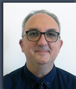
Sylvain COINTAT Président Maire de Tracy-sur-Loire