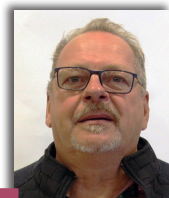
Bernard GILOT Maire de Mesves-sur-Loire