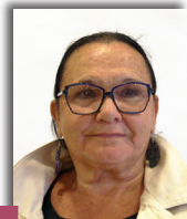
Nadège COQUILLAT Maire de St-Martin- sur-Nohain