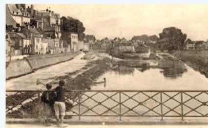
Gare d'eau de la Nièvre

! Prévoir des vêtements adaptés à la météo