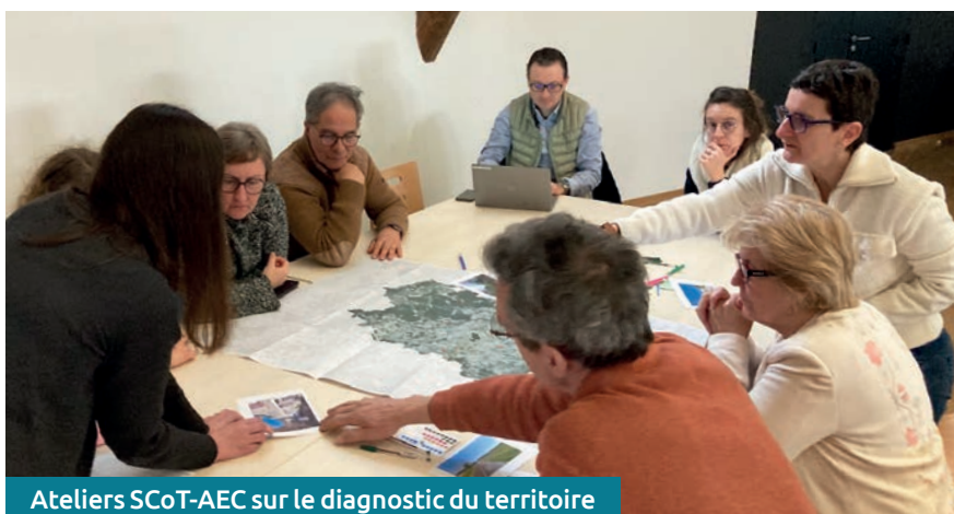
Ateliers SCoT-AEC sur le diagnostic du territoire

Comment mieux préparer nos villes et villages à faire face aux changements climatiques ? Comment penser l'habitat de demain et le développement économique tout en protégeant nos espaces naturels ? Toutes ces questions sont autant de défis pour assurer un développement durable de notre territoire pour les 20 prochaines années. Pour y répondre, les élus de Cœur de Loire se sont lancés dans l'élaboration du Schéma de Cohérence Territoriale valant Plan Climat Air Energie Territorial (SCoT-AEC).